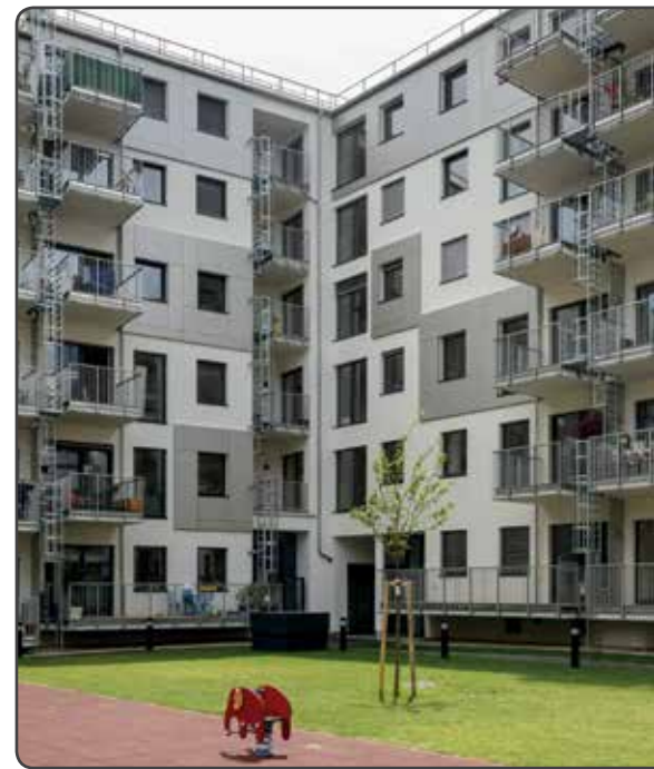
Sieger 2018 Kategorie „Wohnbau“: Lobmeyrhof in Wien Lorenz-Mandl-Gasse 10-16, 1160 Wien GSD Gesellschaft für Stadt- und Dorferneuerung m.b.H. Verarbeitung: ARGE Solut GmbH, Voitl & Co Baugesellschaft m.b.H.

Die ARGE Qualitätsgruppe Wärmedämmsysteme vereint die größten Anbieter von Wärmedämmverbundsystemen in Österreich: Baumit, Capatect, Röfix und Sto. Ein Großteil aller in Österreich verarbeiteten Wärmedämmverbundsysteme kommen aus den Betrieben dieser vier Unternehmen. Ziel der QG WDS ist es, private und öffentliche Bauherren über die Vorteile von Wärmedämmsystemen zu informieren und die Verarbeitungsqualität zu steigern. Den aktuellen und kommenden Anforderungen und Marktentwicklungen begegnet die QG WDS mit breit gefächerten, inhaltlich verschränkter Aktivität. Nachhaltigkeit und neue Formen der Energieeinsparung sind in das Gesamtkonzept Wärmeschutz einbezogen, WDVS stehen im Fokus.