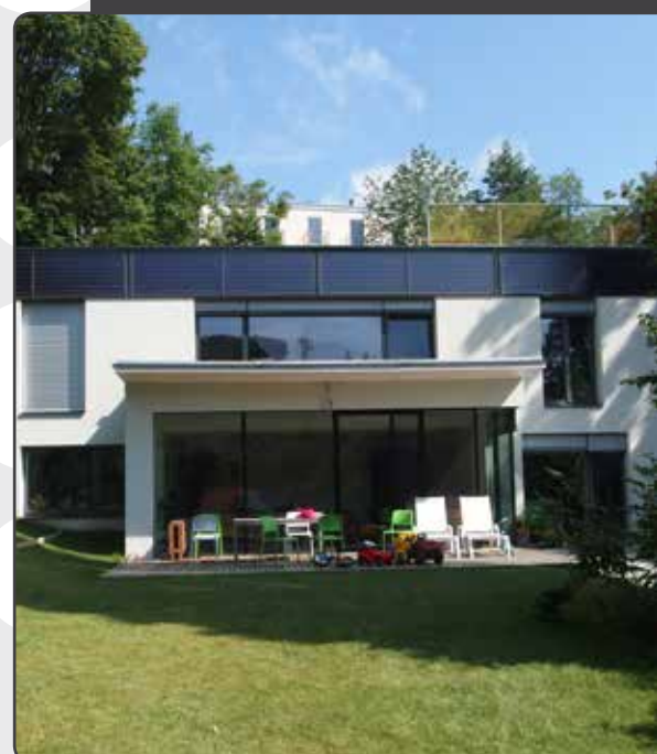
Sieger 2018 Kategorie „Einfamilienhaus“ Haus L. 1180 Wien ARCHITEKTURBÜRO REINBERG ZT GMBH Verarbeitung: Felzmann Bau GmbH